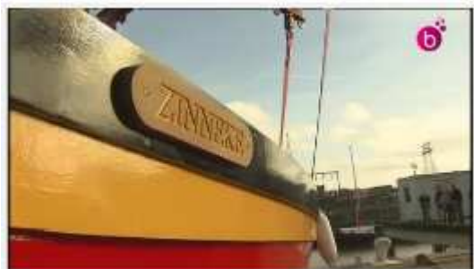
La yole 'Zinneke' pour les jeunes dévotés